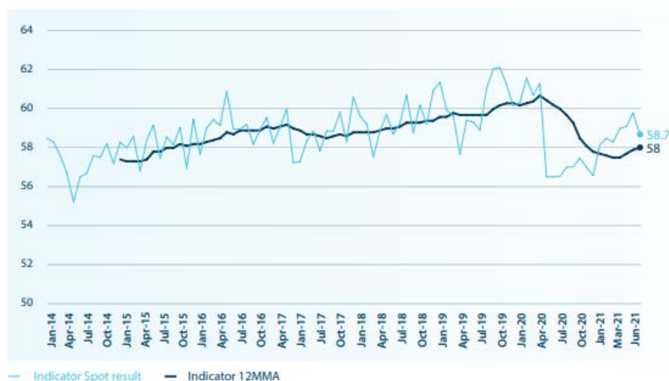
図表 1. ANZ ロイモーガン FWBI

最新調査は 2021 年 4-6 月期のものだ。FWBI は 2020 年初めにパンデミックからの打撃により急低下した後、2020 年半ばから 2021 年 5 月にかけて安定的に回復したが、6 月に悪化した。6 月の低下はシドニーにおける新型コロナウイルス新規感染者数の増加への懸念の高まりによるものだ。これは結局同月のロックダウンにつながった (毎年、年央に低下する傾向があるがデータは季節調整されていない)。