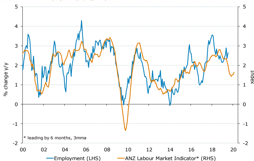
図表 1. ANZ 労働市場指標と雇用

Source: ABS, SEEK, NAB, Westpac, ANZ Research □